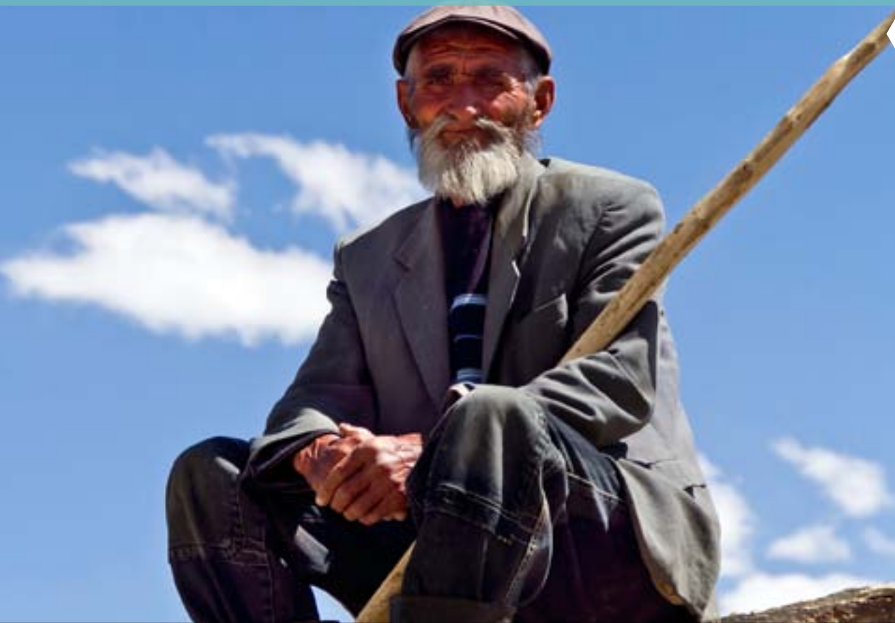
EN ELDRE GJETER SOM BOR I EN AV DALSIDENE AV PAMIRFJELLENE.

religionsfriheten i landet. Blant annet er det innført en kontroversiell lov som forbyr religiøs aktivitet blant barn og unge. Loven innebærer nærmest totalforbud mot at barn deltar i religiøse aktiviteter, uansett religion, og flere er nå blitt bøtelagt for brudd på denne loven. Det er også innført sterke begrensninger på det å ta religiøs utdanning. Alle trosretninger, også islam, er underlagt meget streng statlig kontroll, og det meldes om at myndighetene har stengt flere uregistrerte kirker og moskeer.